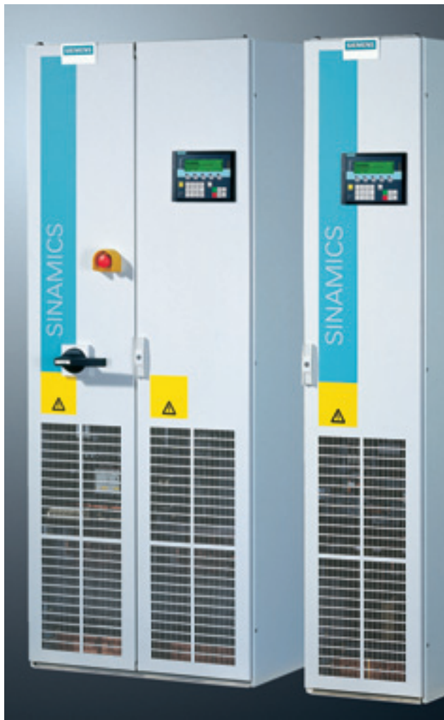
SINAMICS G 150 в исполнениях: "А" (слева) и "С" (справа), мощностью 160 кВт и напряжением питания 380В ЗАС.

Управление и параметрирование преобразователя SINAMICS G 150 при вводе в эксплуатацию и работе осуществляется с панели управления, расположенной на двери шкафа и оснащенной большим графическим дисплеем. Благодаря удобной текстовой системе подсказок обслуживающий персонал легко может управлять устройством в диалоговом режиме. При этом, даже исчезает необходимость в дополнительных инструкциях, поскольку все необходимые параметры, такие как, значение тока и количества оборотов двига-