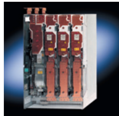
Пример внутренней компоновки SINAMICS G 130

SINAMICS G130 представляет собой преобразователь частоты встраиваемого исполнения (на шасси, IP00). Конструктивно он состоит из двух компонентов – силового модуля и модуля управления CU320. В силовом модуле предусмотрено место для установки модуля управления, но он также может быть смонтирован отдельно, что обеспечивает удобство при монтаже. Связь между компонентами осуществляется при помощи высокоскоростного последовательного интерфейса DRIVE-CliQ, разработанного специально для преобразователей серии SINAMICS. Одним из дополнительных компонентов SINAMICS G130 является панель оператора AOP30 – инструмент для быстрого и удобного ввода в эксплуатацию и контроля параметров. Рабочий диапазон мощностей Sinamics G130 составляет 315 – 560 кВт (3AC 380-480 В) и 315 – 800 кВт (3AC 660-690 В). При выборе материалов для SINAMICS G 150 очень большое внимание уделялось вопросу охраны окружающей среды. Преимущество отдавалось исключительно материалам, которые не содержат вредных компонентов. Компактность, низкие уровни шума и энергопотребления говорят в пользу сохранения окружающей среды. Таким образом, новый преобразователь частоты SINAMICS G 150 обладает целым рядом преимуществ, которые на протяжении всего «жизненного цикла», начиная со стадии упрощенного планирования, продолжая быстрой и простой инсталляцией и вводом в эксплуатацию, надежной и длительной безотказной работой, обеспечивают высокий уровень экономичности системы привода.