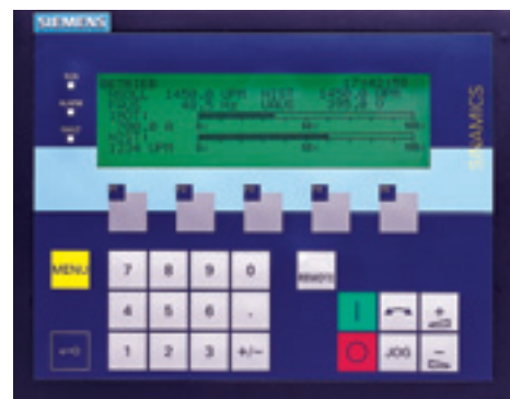
Панель управления преобразователем SINAMICS G 130, G 150

теля отображаются на дисплее. Процесс ввода в эксплуатацию поддерживается пятью свободно параметрируемыми функциональными клавишами. Для быстрого ввода в эксплуатацию достаточно ввести около десяти параметров, после чего автоматическая система поиска быстро идентифицирует электродвигатель и точно определит необходимые параметры для управления им. В процессе функционирования, с помощью графического дисплея возможно отображение до трех параметров привода, таких как, ток, действительное и заданное значения количества оборотов в квазианалоговом виде (в виде графика). Таким образом, возможно легко осуществлять быстрый контроль за «состоянием здоровья» приводных процессов во времени.